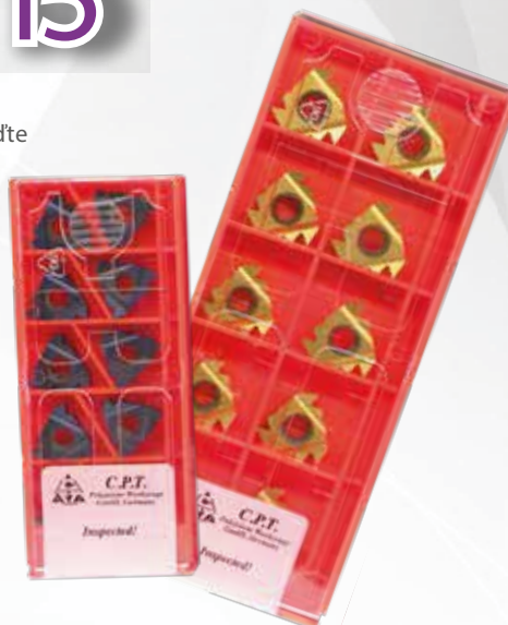
Příklad objednávky: 16ER3.0ISOBLU + 22ER6ABUTMXC 5 x 16ER3.0ISOBLU ZDARMA