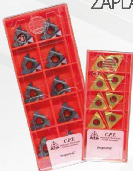
Příklad objednávky: 22ERN60BMA + 16ER28UNMXC 5 x 16ER28UNMXC ZDARMA

V objednávce prosím uveďte akční kód: Tiny-24